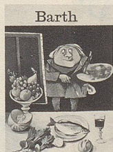
Barth Barth-Karikaturen aus dem Nebelspalter

Die Zusammenstellung der Reisinger-Zeichnungen, unter ihnen eine ganze Reihe in Farben, besorgte der Reisinger-Kenner und Kollege Fritz Behrendt, der in seinem Vorwort über ihn schreibt: «Seine definitive Berufswahl ist ein richtiger und segensreicher Entschluss gewesen, zur Freude vieler Menschen überall in der Welt.»