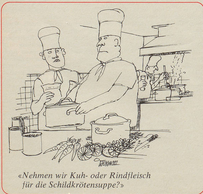
«Nehmen wir Kuh- oder Rindfleisch für die Schildkrötensuppe?»

Senkrecht: 1 steril, 2 Lugano, 3 Chrom, 4 Waerter, 5 Heim, 6 Tat, 7 Aera, 8 Ras, 9 trueb, 10 Men, 11 et, 12 Boe, 13 Reh, 14 TG, 15 jeder, 16 parat, 17 Rev., 18 Ton, 19 Aas, 20 Rodel, 21 Druck, 22 En, 23 Rat, 24 Ree, 25 ha, 26 rit., 27 Datum, 28 bar, 29 echt, 30 nah, 31 Birr, 32 Theodul, 33 Geste, 34 Status, 35 Winter.