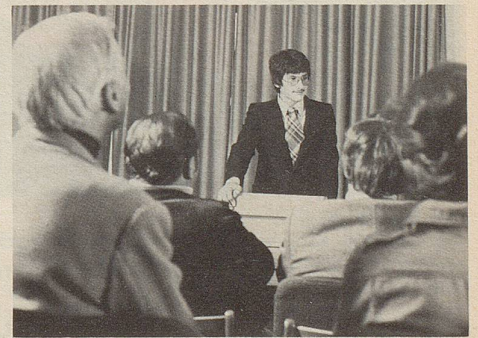
Momente höchster nervlicher Spannung: Der erste Vortrag. Da bewähren sich Zeller Entspannungs-Dragees