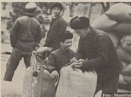
Versteigerung heilkräftiger Kräuter auf einem orientalischen Markt