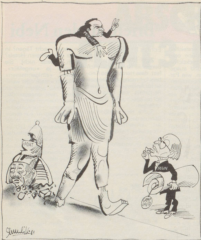
Situationsbericht aus dem Nahen Osten rapportiert vom israelischen Karikaturisten Shmuel Katz