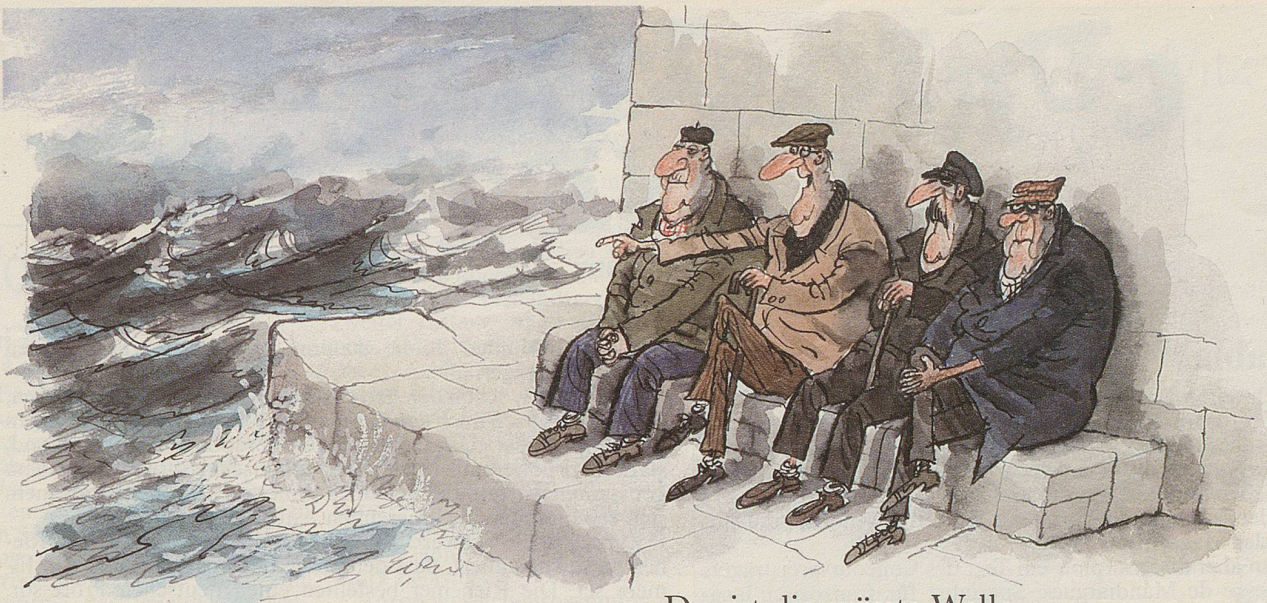
«Das ist die grösste Welle ...»