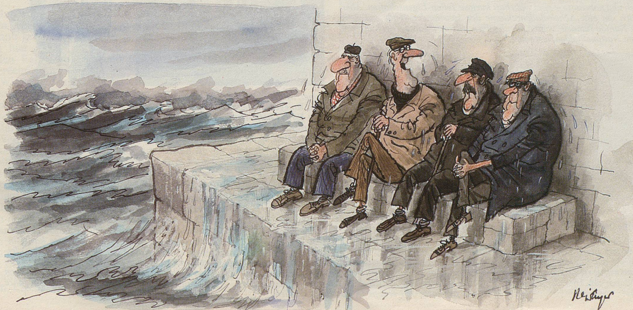
«Nun, was habe ich gesagt!»