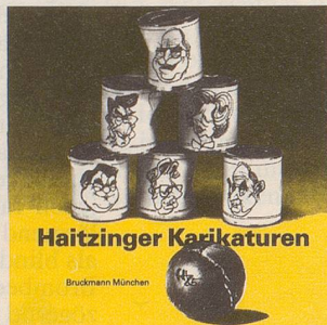
Horst Haitzinger Haitzinger Karikaturen 85 72 Seiten, gebunden, Fr. 15.80