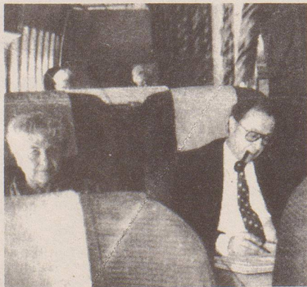
The Minister for Foreign Affairs, Mr Pierre Aubert, and his wife during one of the quieter moments. (... auf seiner jüngsten Asienreise im Flugzeug. Hinter ihm sollen «the Minister for Defense, Mr Jean-Pascal Delamurez, and his wife» gesessen haben; d. Red.)