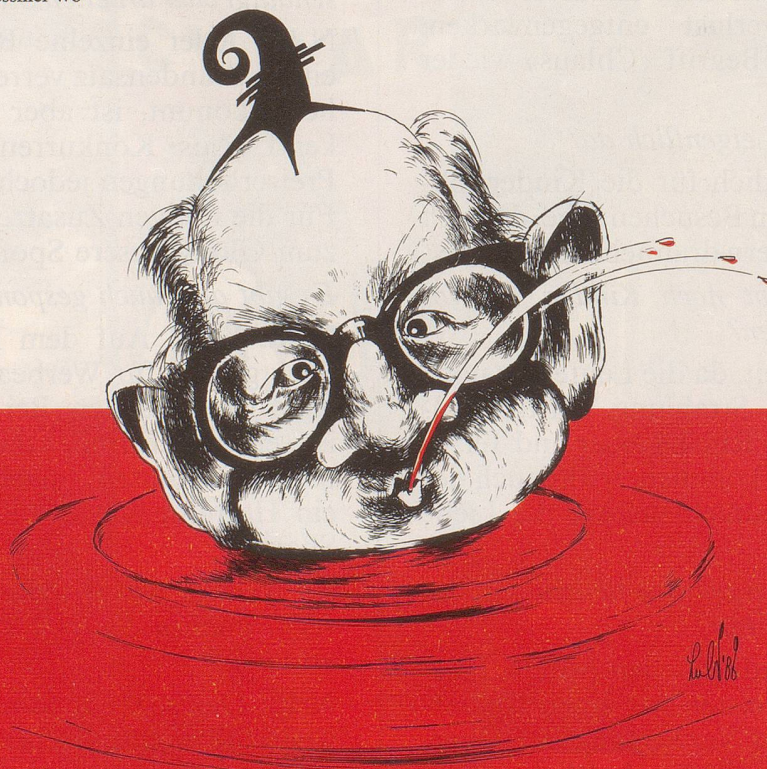
Rhein oder nicht rein ...