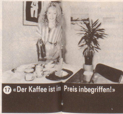
17 «Der Kaffee ist im Preis inbegriffen!»