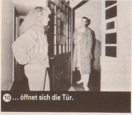
10 ... öffnet sich die Tür.