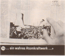
16 ... ein wahres Atomkraftwerk ...»