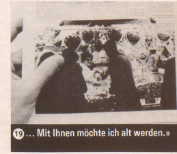
19 ... Mit Ihnen möchte ich alt werden.»