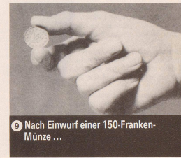
9 Nach Einwurf einer 150-Franken-Münze ...