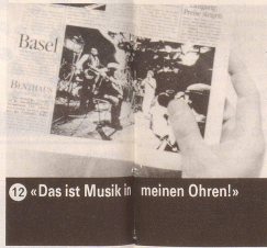
12 «Das ist Musik in meinen Ohren!»