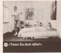
13 «Treten Sie doch näher!»