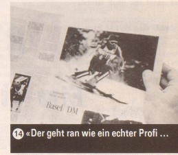
14 «Der geht ran wie ein echter Profi ...