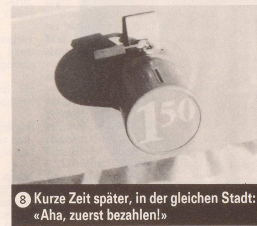
8 Kurze Zeit später, in der gleichen Stadt: «Aha, zuerst bezahlen!»