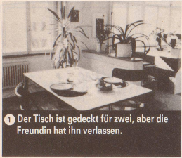
1 Der Tisch ist gedeckt für zwei, aber die Freundin hat ihn verlassen.