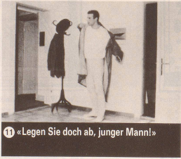
11 «Legen Sie doch ab, junger Mann!»