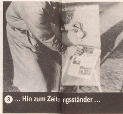
3 ... Hin zum Zeitungsstand ...