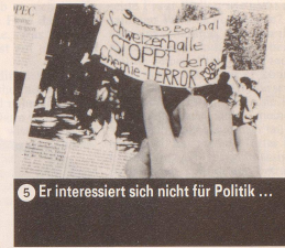
5 Er interessiert sich nicht für Politik ...