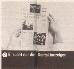
7 Er sucht nur die Kontaktanzeigen.