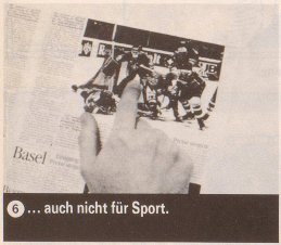
6 ... auch nicht für Sport.