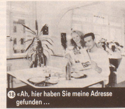
18 «Ah, hier haben Sie meine Adresse gefunden ...