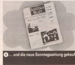
4 ... und die neue Sonntagszeitung gekauft.