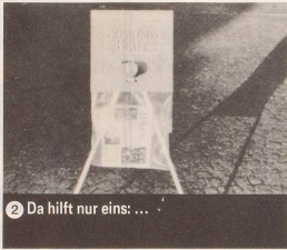
2 Da hilft nur eins: ...