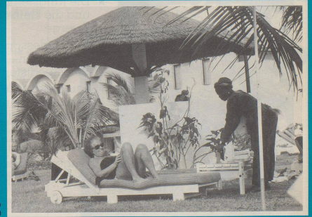
8 Aber bitte nume i de Ferie!