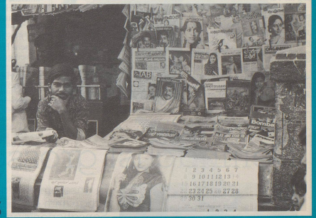
5 Da faszinierend Tamil ...