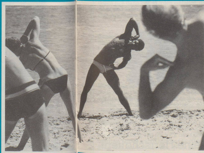
7 ... da geil Zairer!