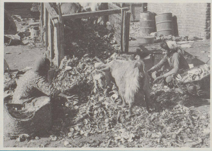
3 Die pittoresk Unordnig ...