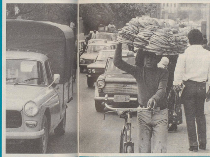
4 ... die geschickte und flinke Kinder!