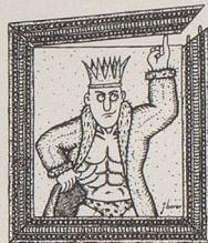
Max der Starke