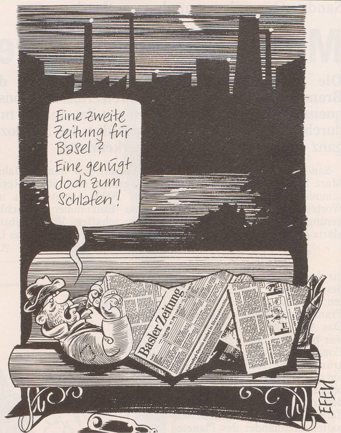
Lanciert das Haus Ringier in Basel eine zweite grosse Tageszeitung? Der Entscheid dazu soll im Lauf des Sommers fallen.