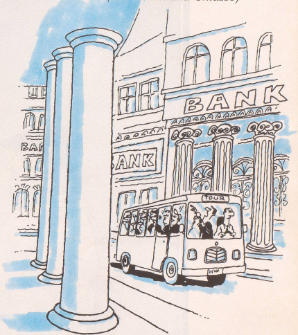
Speziell für Amerikaner: Tour durch den Schweizer Banken-Dschungel: «... und links lagern im Untergeschoss 200 Millionen Franken von Herrn Marcos, rechts, etwa zehn Meter unter Strassenniveau, werden 15 Millionen Franken Contra-Gelder vermutet, sofern sie richtig verbucht sind.»