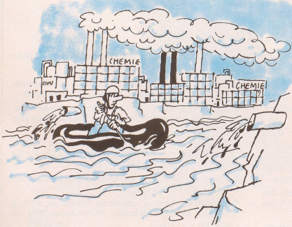
Trotz unserer gezähmten, begradigten und gestauten Flüsse sind gefährliche Wildwasserfahrten auch heute noch möglich.