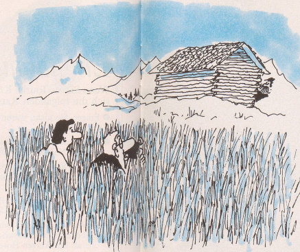
Abenteuerliche Photosafaris auf den Spuren einer fast ausgestorbenen Spezies: «Da haben wir aber wahnsinnig Glück gehabt: ein echter Bündner Bergbauer!»