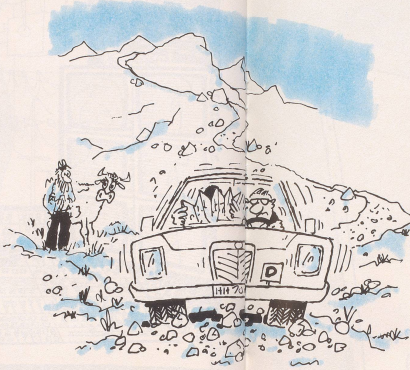
Etwas ganz Besonderes für abenteuerlustige Deutsche: die Schweizer Geröllhalden- und Bergwästen-Rallye zwischen der deutschen und italienischen Grenze ganz ohne Autobahnvignette!