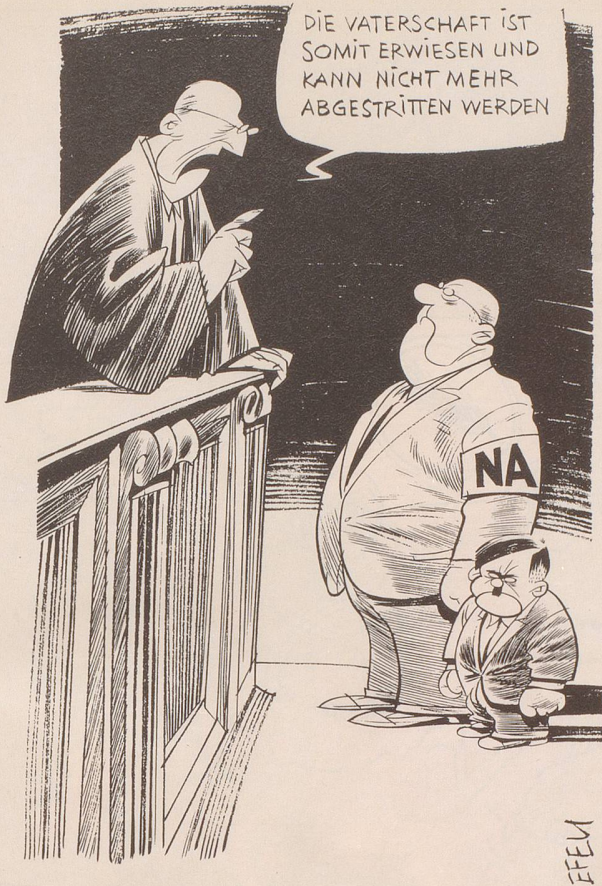
Das Bundesgericht hat festgehalten: Die Nationale Aktion (NA) darf als «nazihft rassistisch» bezeichnet werden.