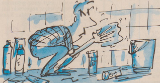
Hausmann R. S. in F: «Was meinen Sie mit Putzneurose?»

NOCH EINMAL: ICH BIN KEIN HAUSMANN, ICH HEISSE HAUSMANN.