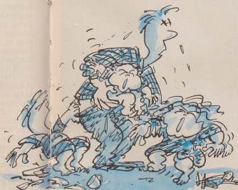
Von Hausmann A. N. in V. momentan kein Kommentar