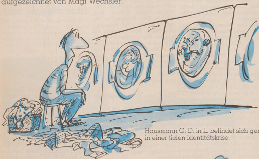
Hausmann G. D. in L. befindet sich gerade in einer tiefen Identitätskrise.

Überall beginnen sich die im Haushalt tätigen Männer mit ihrem Schicksal auseinanderzusetzen; Gedankenaustausch und gegenseitige Ermunterung sollen zu einem besseren Selbstverständnis führen. Zur Situation der Hausmänner in der Schweiz hier ein paar Beispiele, recherchiert und aufgezichnet von Magi Wechsler.