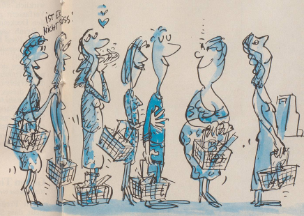
Hausmann P. L. in T. geht am liebsten einkaufen.