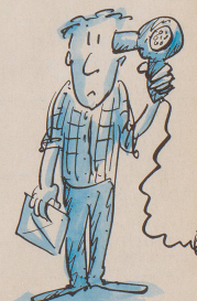
Hausmann L. M. in Z. gibt auf!