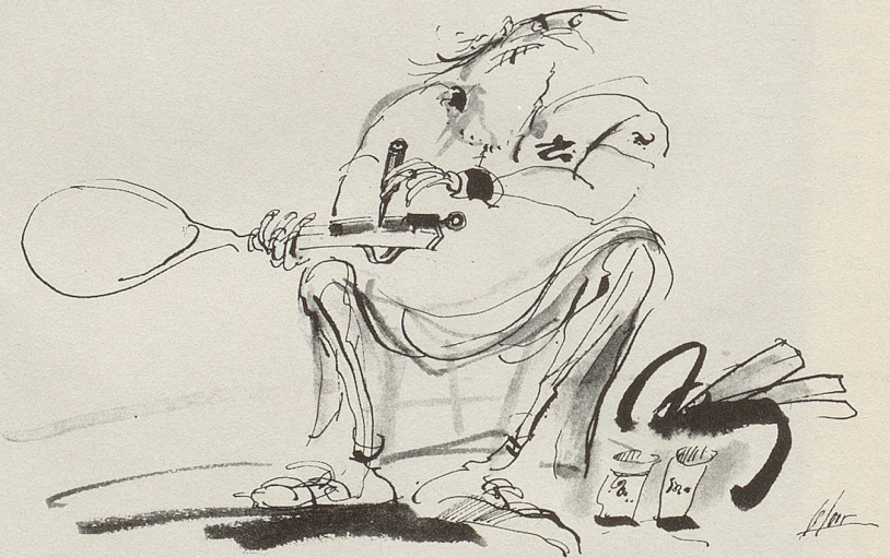
Vor dem tie-break