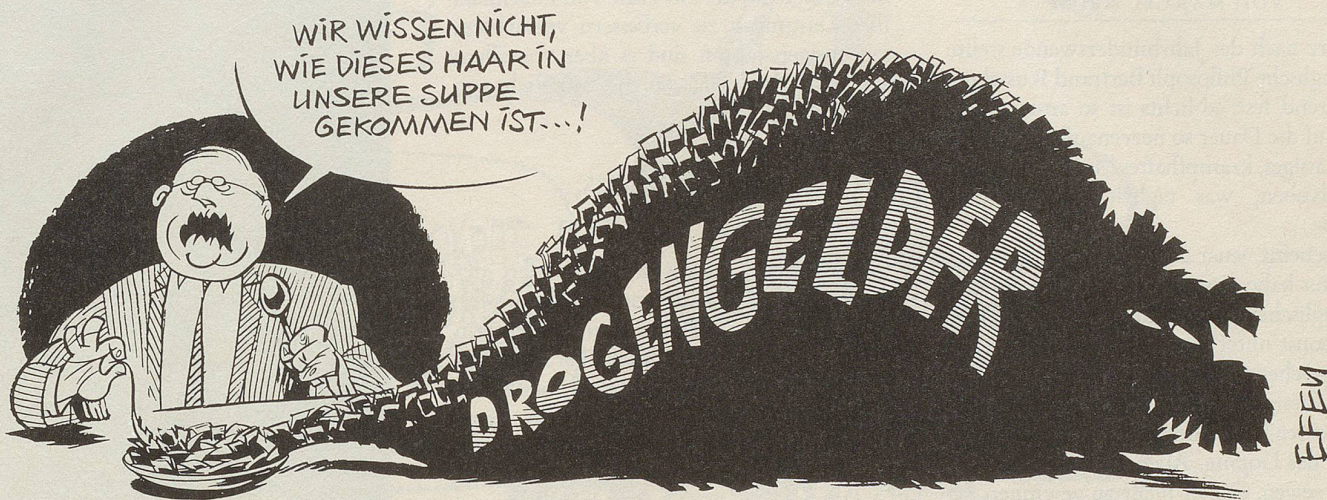
In der Geldwäschereiaffäre, bei der 1,5 Milliarden Franken Drogengeld in der Schweiz reingewaschen worden sein sollen, haben die Grossbanken eigenen Angaben zufolge ihre Sorgfaltspflichten ernstgenommen.