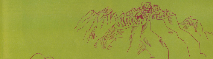
Neu: Die Wein-Bergbauern