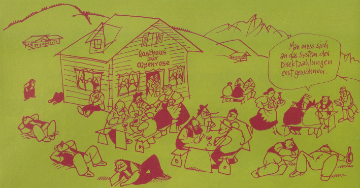
Der Weg zur Europatauglichkeit