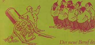
Der neue Beruf des Schneekanoniers