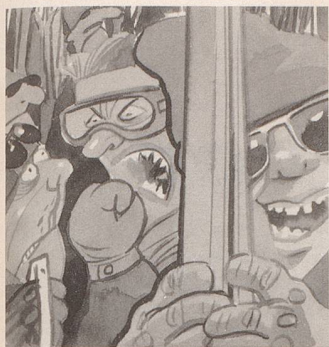
Ernst Feurer-Mettler im «Klick»: