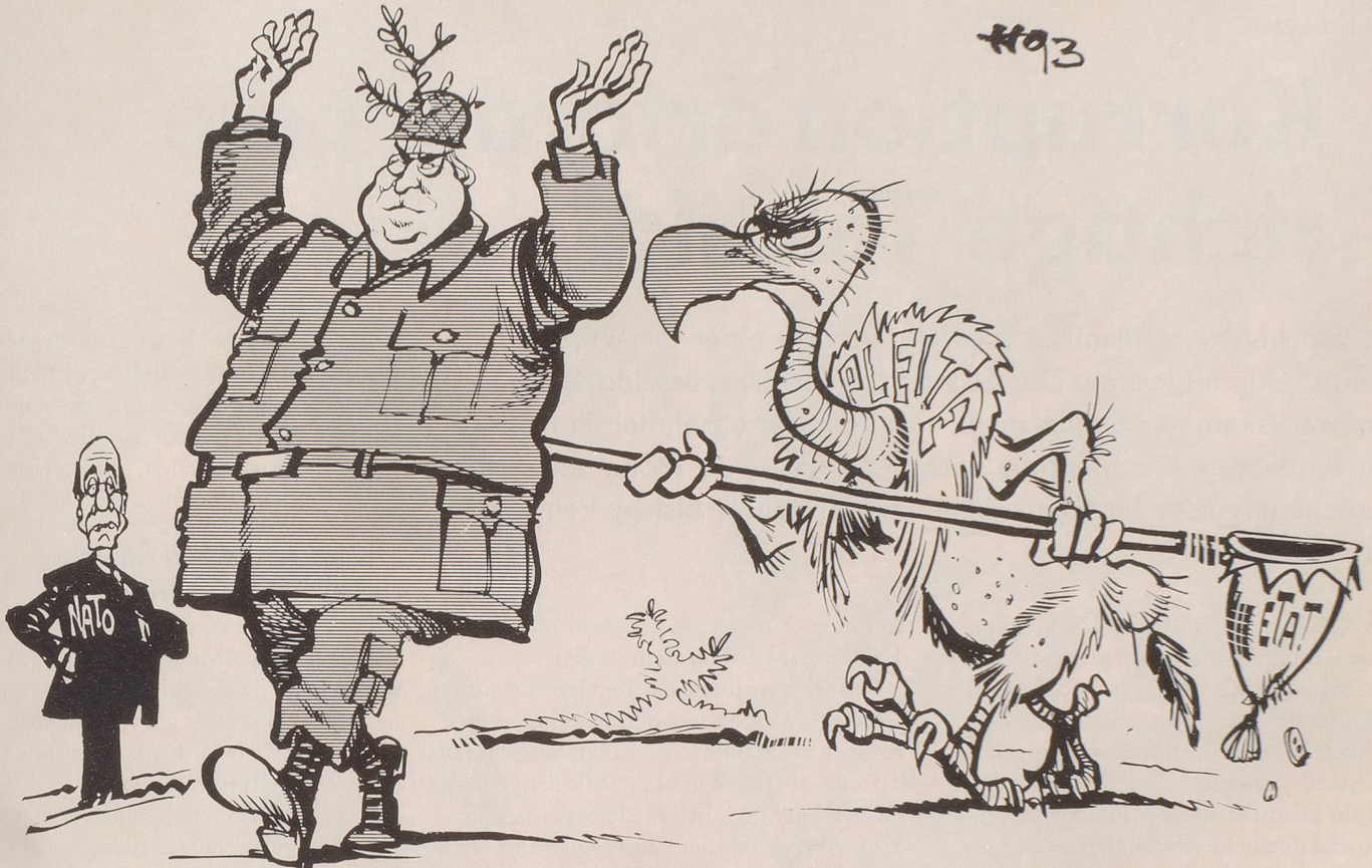
Hauptmann Kohl in Gefangenschaft