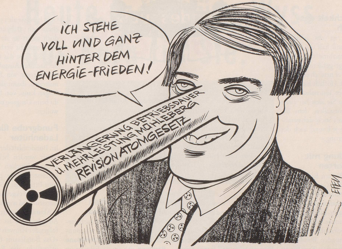
Der Bundesrat will die Mitsprache der Kantone beim Bau der Endlager für radioaktive Abfälle stark einschränken ...