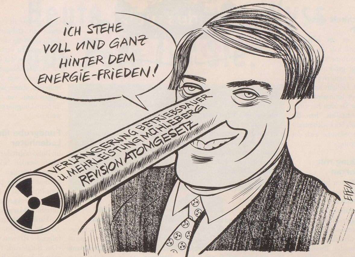
Der Bundesrat will die Mitsprache der Kantone beim Bau der Endlager für radioaktive Abfälle stark einschränken ...