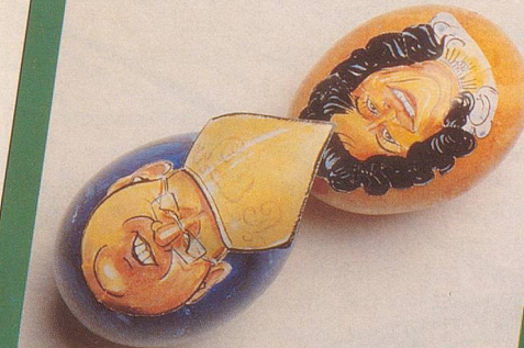
Geht an Ostern Haas der Uriella an den Geist?

Machen Sie aus dem Eiertütschen diesmal ein fröhliches Kopf-an-Kopf-Rennen! Nebi-Caroonist Orlando Eisenmann hat sechs bekannte Gesichter als farbige Eierköpfe gezeichnet. Dieses exklusive, auf Ostereier-Kleber gedruckte Prominenten-Set können Sie jetzt bestellen. Nebelspalter-Abonnenten für nur 5 Franken. Und alle anderen für 10 Franken (inklusive Porto und Versand).