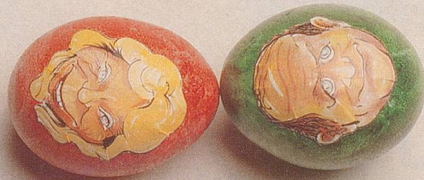
Tütscht Trütsch Brunner?