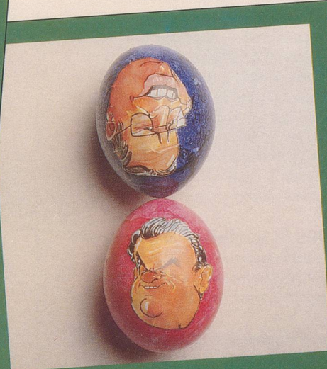
Wer hat die härtere Schale: Stich oder Blocher?