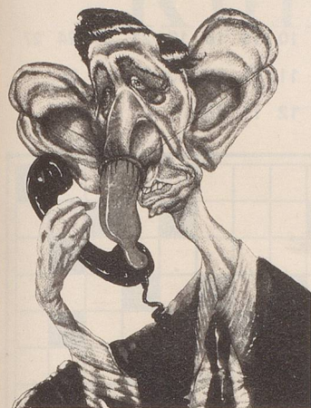
Gradimir Smudja: Karikatur von Prinz Charles in Nr. 8 (Fasnachtsausgabe)