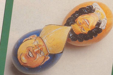
Geht an Ostern Haas der Uriella an den Geist?

Machen Sie aus dem Eiertütschen diesmal ein fröhliches Kopf-an-Kopf-Rennen! Nebi-Cartoonist Orlando Eisenmann hat sechs bekannte Gesichter als farbige Eierköpfe gezeichnet. Dieses exklusive, auf Ostereier-Kleber gedruckte Prominenten-Set können Sie jetzt bestellen. Nebelspalter-Abonnenten für nur 5 Franken. Und alle anderen für 10 Franken (inklusive Porto und Versand).