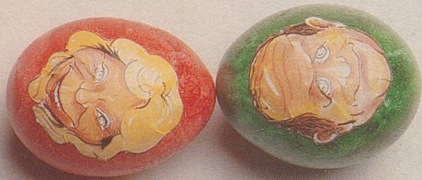
Tütscht Trütsch Brunner?