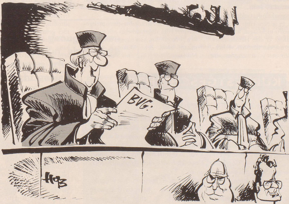
«Wir haben folgende Entscheidung der Bundesregierung beschlossen ...»