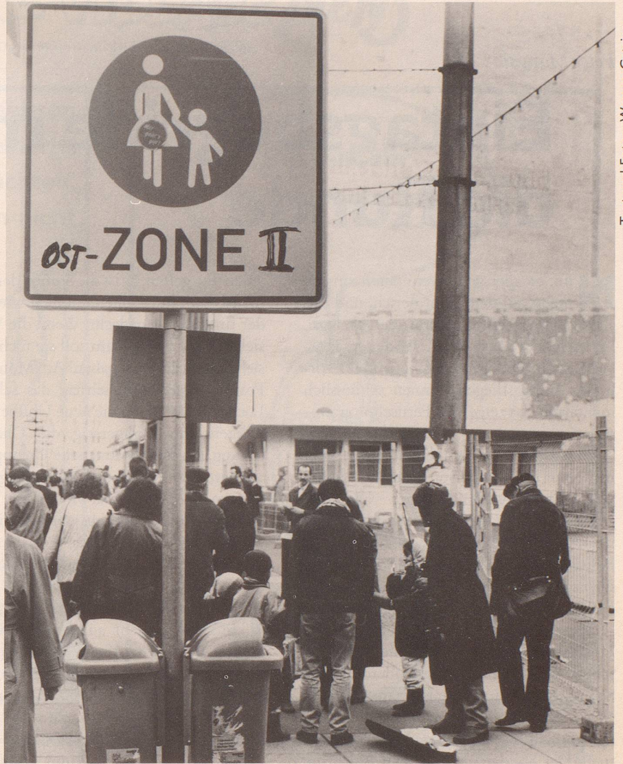
8 Doch wenn man die Lage nüchtern betrachtet, ...