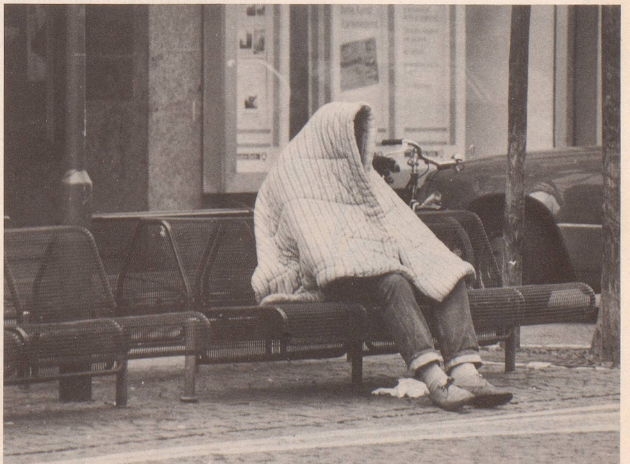
9 ... blieb manches beim alten.