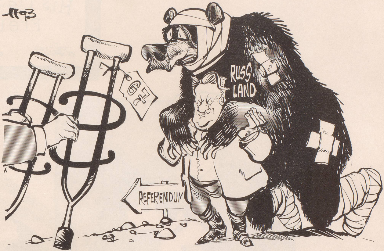
Liebesgrüsse aus Tokio