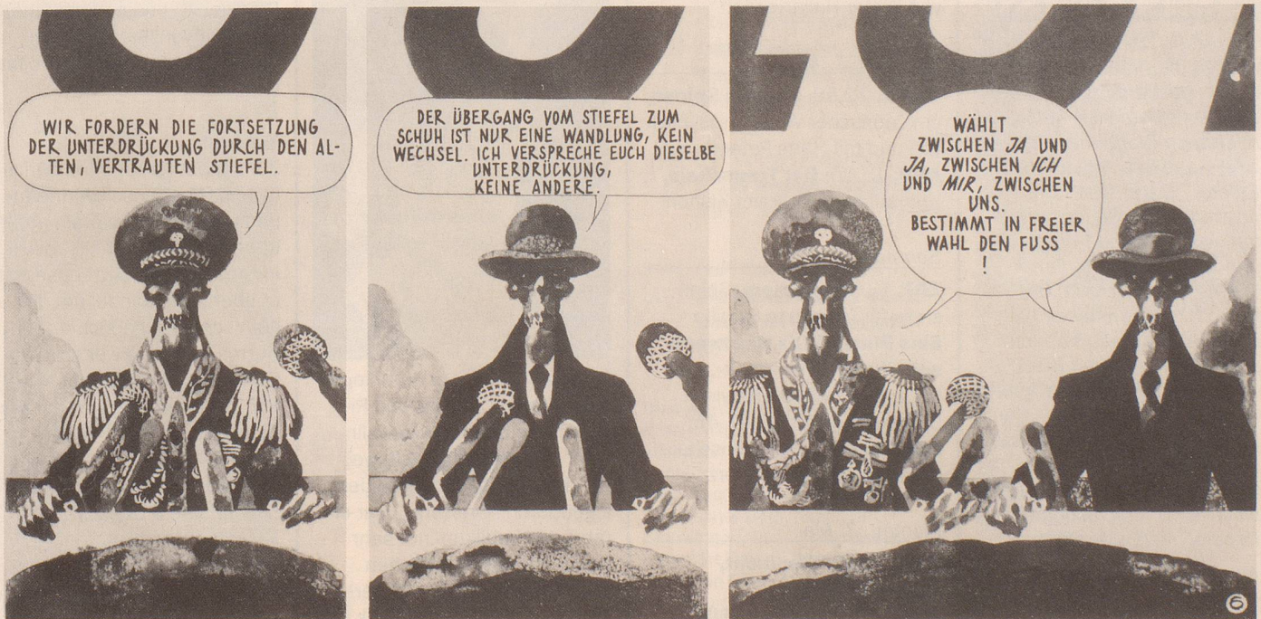
Wo freie Wahlen zur Farce verkommen.