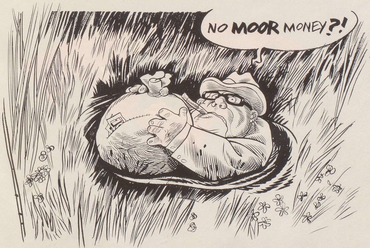
Manche Lobbyisten können sich nicht damit abfinden, dass die Moorlandschaften, wie per Volksabstimmung beschlossen, tatsächlich geschützt sein sollen ...