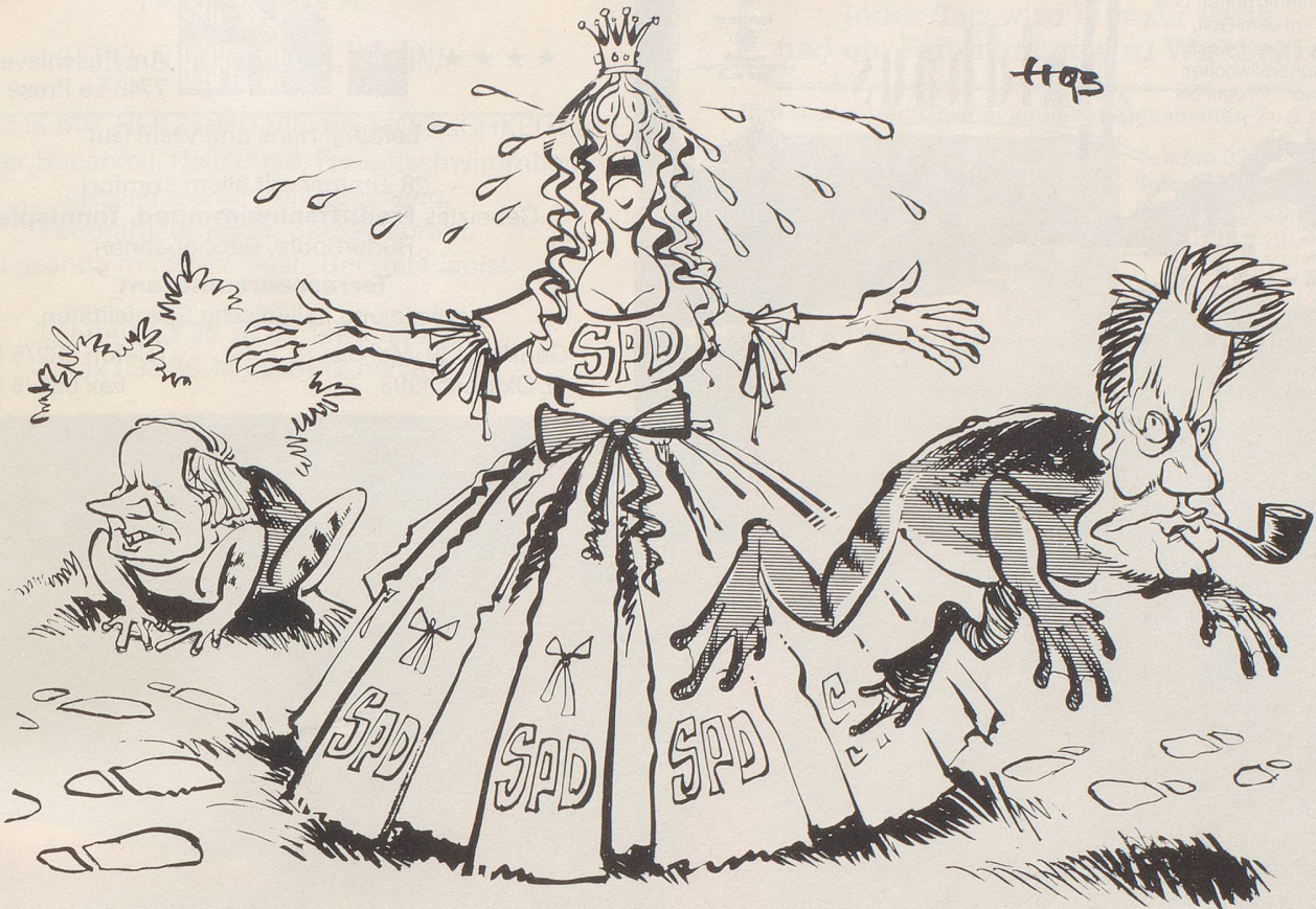
«... jedesmal, wenn ich einen Prinzen küsse!»