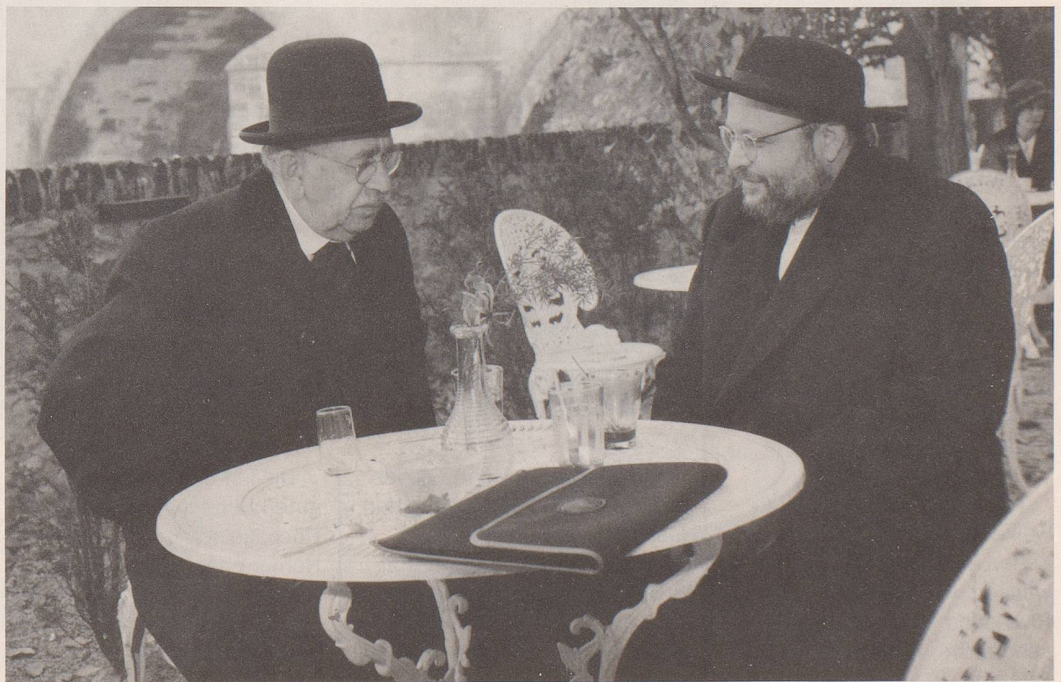
Bronzene Rose der Sparte Humor für den gelungenen Beitrag «Respectful Greetings, Mr. Kohn!» der Cseka Televize aus Prag.