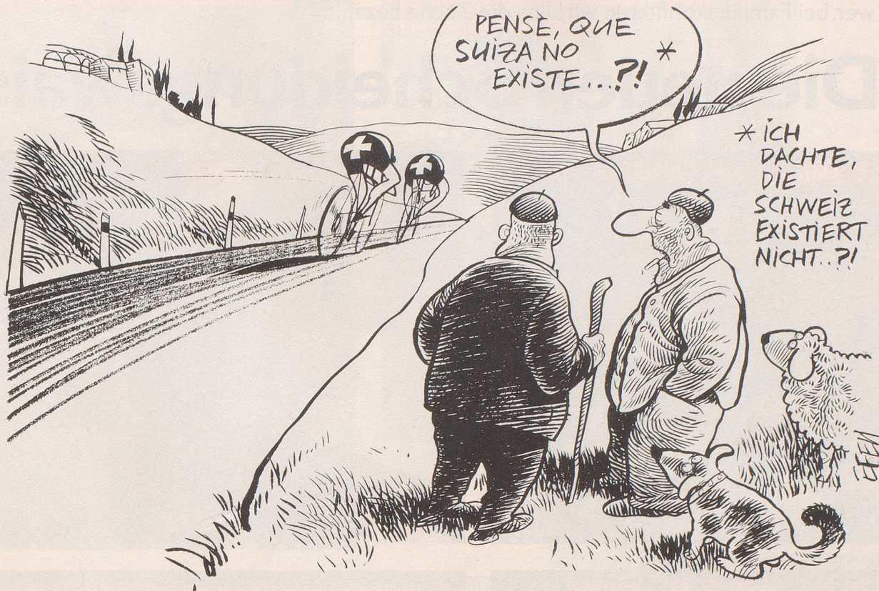
Toni Rominger und Alex Zülle bewiesen in der Spanien-Rundfahrt, dass die Schweiz – im Gegensatz zur berüchtigten Behauptung im Schweizer Pavillon an der Weltausstellung in Sevilla – sehr wohl existiert ...