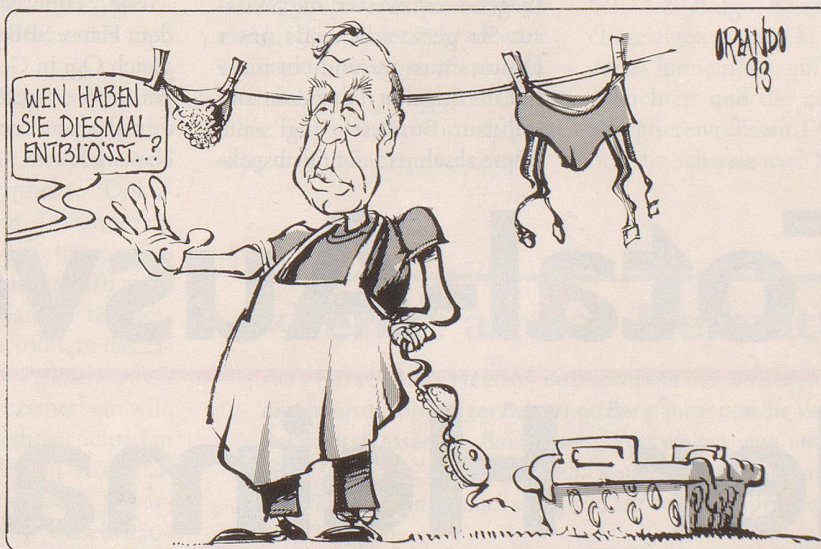
Hat Ziegler selber Dreck am Stecken?