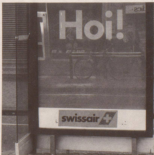
9 ... und ein besonders heimeliger Umgangston.