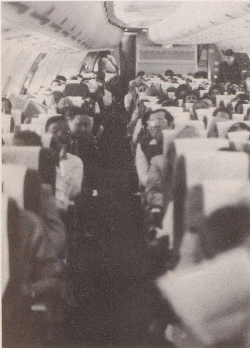
5 ... den Reisekomfort.