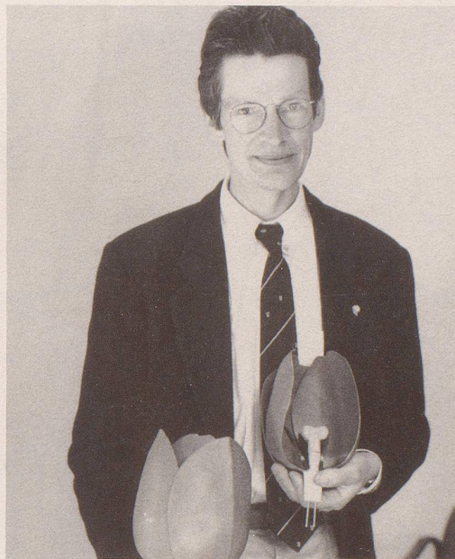
8 Neu bei der Swissair sind Blumen für die Damen ...