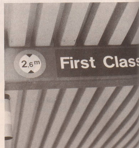
4 ... und erhöhen mit noch grösserer Beinfreiheit ...