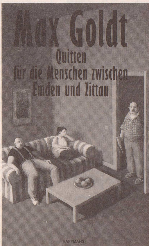
Max Goldt: «Quitten für die Menschen zwischen Emden und Zittau», Haffmans Verlag, 1993, Fr. 28.50