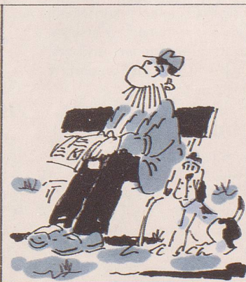
Man kann nur hoffen, dass es bald einen Pilotversuch