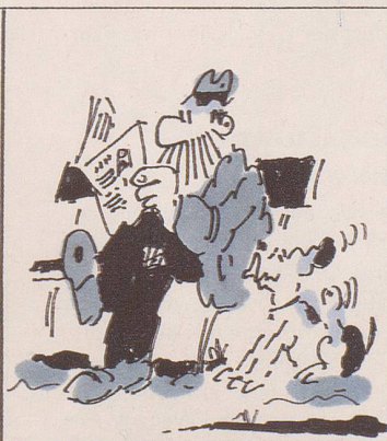
und nun dieser Pilotversuch mit A- und B-Soldaten: