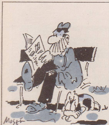
Erst die A- und B-Post