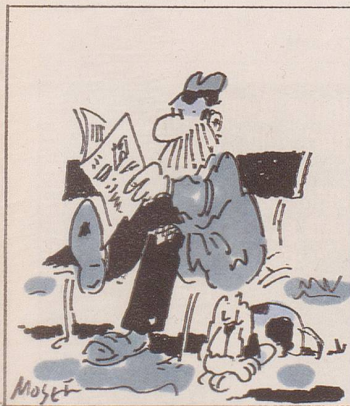
Erst die A- und B-Post