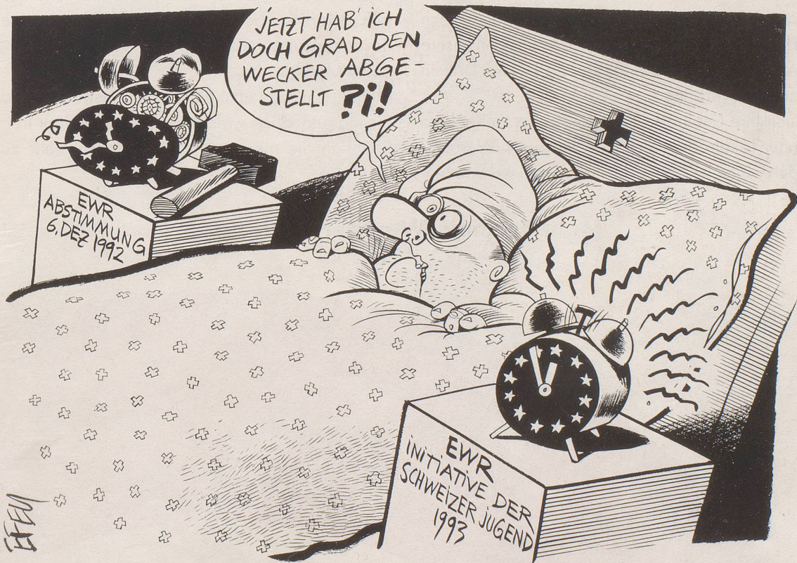
Die Jugendbewegung «Geboren am 7. Dezember» hat 119724 Unterschriften für ihre Pro-EWR-Initiative gesammelt ...