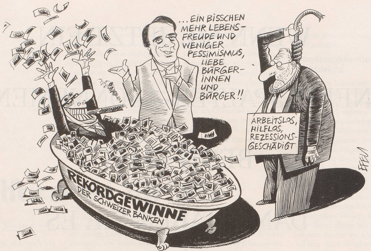
Adolf Ogi, Bundespräsident, Animator und beruf(ung)smässiger Optimist ...