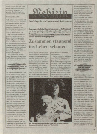
Ursus & Nadeschkin