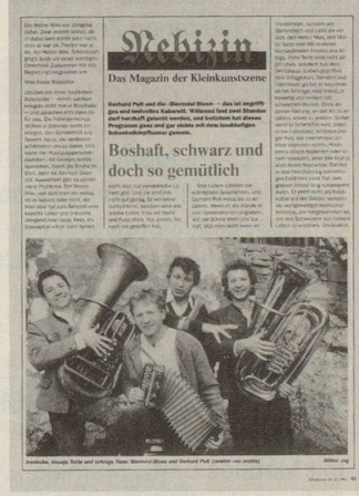
Gerhard Polt, Biermösl Blosn