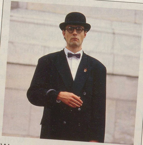
Wenn auch Sie zu den Leuten gehören möchten ...

In einer tierisch ernstesten Zeit, ein satirisch heiterer Pin.