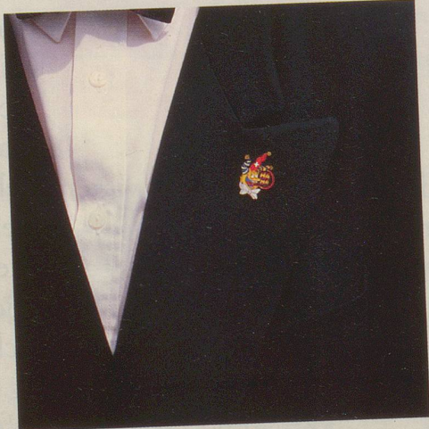
... dann bestellen Sie doch ganz einfach ...