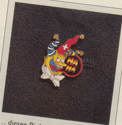
... diesen Pin!

Dieses Lachen kann man überall anstecken – und es steckt überall zum Lachen an: Der offizielle Nebelspalter -Pin, gezeichnet von Nebi -Cartoonist Ian D. Marsden und hergestellt in luxuriöser Ausführung mit fünf verschiedenen Farben. Begehrt von vielen, aber erhältlich nur für Nebelspalter -Abonnenten.