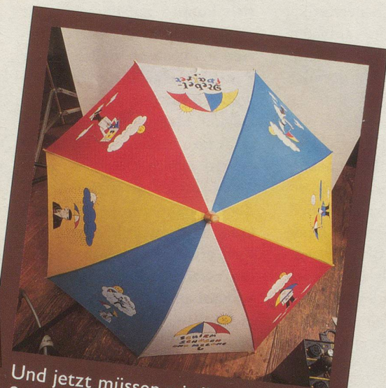
Und jetzt müssen wir Ihnen den Schirm halt ohne Herrn Schüüch zeigen.

Wir hoffen, dass Sie dies dem Herrn Schüüch nicht übelnehmen und den Schirm trotzdem bestellen. Denn eines können Sie sicher sein: Sein Schirm lässt Sie garantiert nie im Regen stehen! (Gezeichnet von Hans Moser und für Nebelspalter -Abonnenten zum Spezialpreis erhältlich: nur 39.— Franken. Nicht-Abonnenten 58.— Franken.)