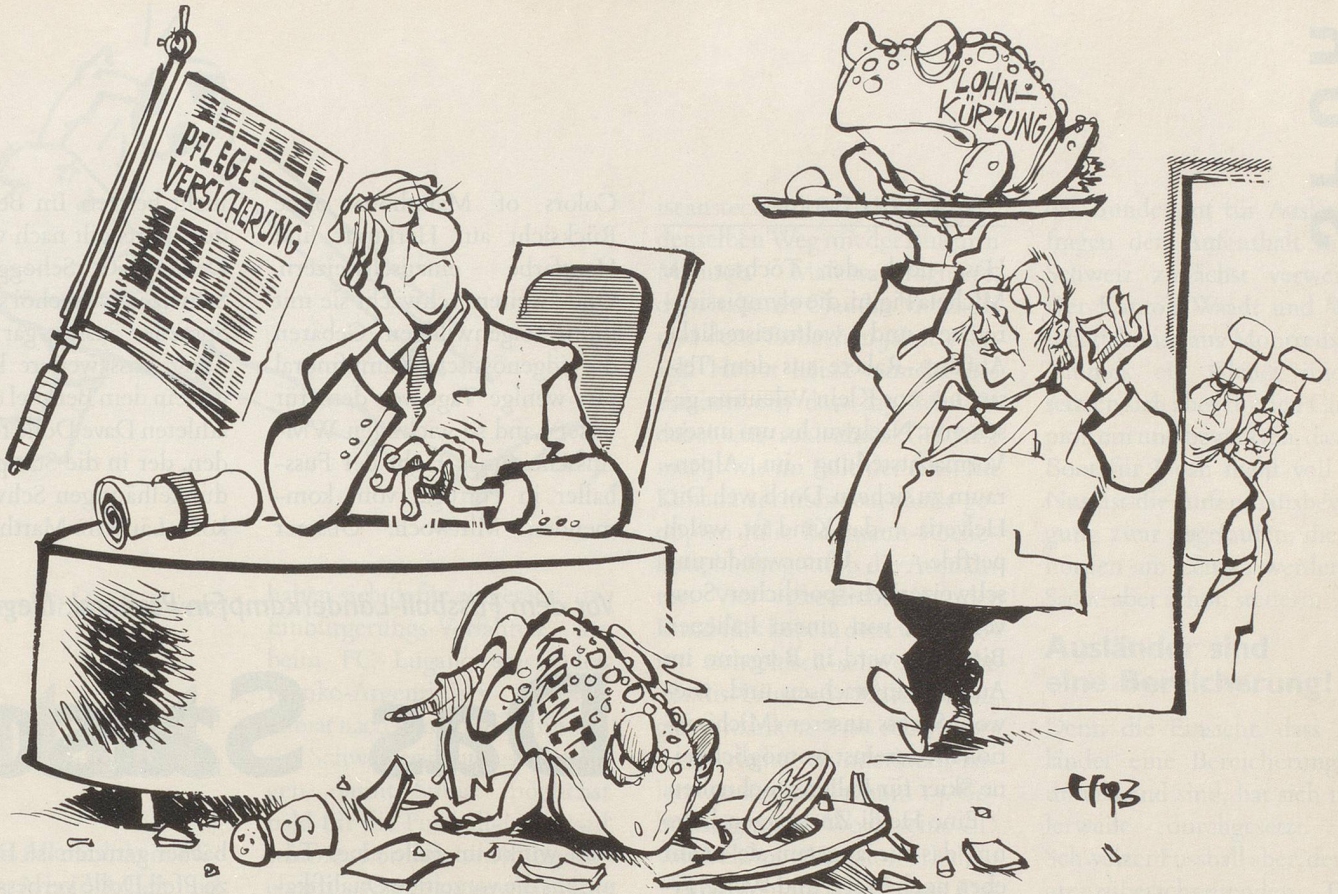
«... jetzt aber wirklich was ganz Leckeres!»