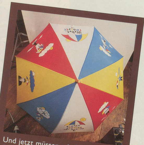
Und jetzt müssen wir Ihnen den Schirm halt ohne Herrn Schüüch zeigen.

Wir hoffen, dass Sie dies dem Herrn Schüüch nicht übelnehmen und den Schirm trotzdem bestellen. Denn eines können Sie sicher sein: Sein Schirm lässt Sie garantiert nie im Regen stehen! (Gezeichnet von Hans Moser und für Nebelspalter -Abonnenten zum Spezialpreis erhältlich: nur 39.— Franken. Nicht-Abonnenten 58.— Franken.)