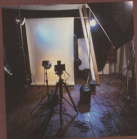
Aber dann hat er sich leider nicht getraut.