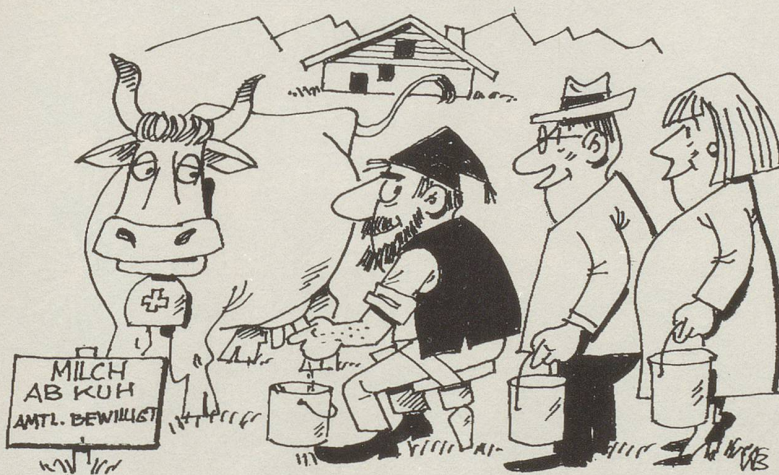
Milchordnung wird neu geregelt

Nach fünf Jahren, einwandfreier Leumund vorausgesetzt, dürfen sie über einen Drittel ihres Lohnes frei verfügen. Die Empfängnisverhütung ist Pflicht. Für jedes Kind muss ein begründeter, befristeter Antrag eingereicht werden. Zur Gesundheitsbetreuung sind Spezialärzte einzusetzen. Wir denken dabei an Studienabgänger, die sich so, praxisgerecht, in ihren schwierigen Beruf einarbeiten können. Grössere Investitionen, Autos, Wohnungseinrichtungen usw., bedürfen einer Sondergenehmigung. Ausländer sind ein weites Potential. Unser ausgereiftes Konzept trägt dem Rechnung. Beide Seiten haben so Gewähr für das einwandfreie Funktionieren neben und miteinander.