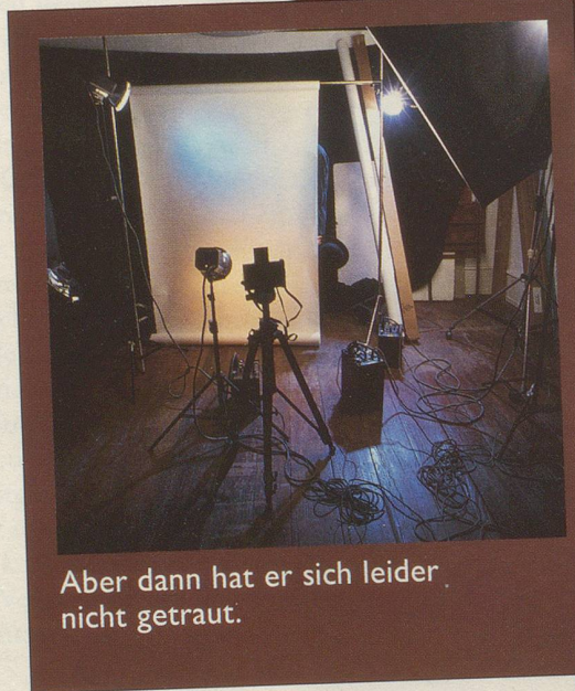
Aber dann hat er sich leider nicht getraut.