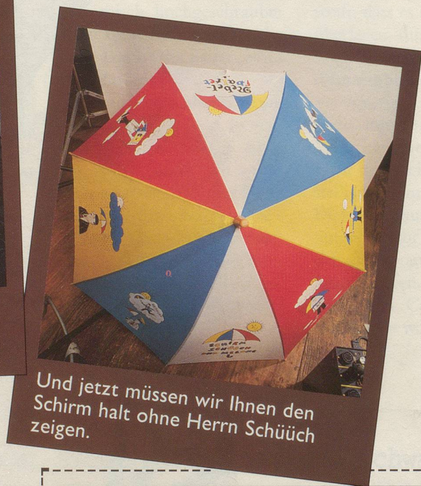
Und jetzt müssen wir Ihnen den Schirm halt ohne Herrn Schüüch zeigen.

Wir hoffen, dass Sie dies dem Herrn Schüüch nicht übelnehmen und den Schirm trotzdem bestellen. Denn eines können Sie sicher sein: Sein Schirm lässt Sie garantiert nie im Regen stehen! (Gezeichnet von Hans Moser und für Nebelspalter -Abonnenten zum Spezialpreis erhältlich: nur 39.— Franken. Nicht-Abonnenten 58.— Franken.)