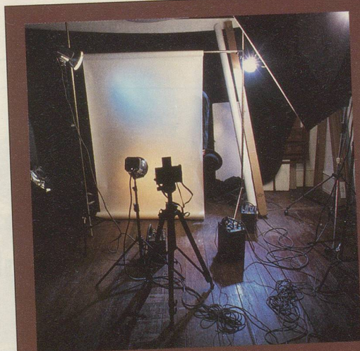
Aber dann hat er sich leider nicht getraut.