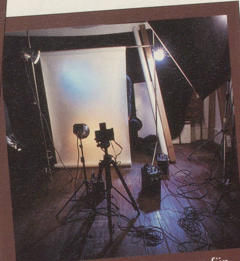
Eigentlich hätten wir ihn gerne für dieses Inserat zusammen mit dem Herr-Schüüch-Schirm fotografiert.