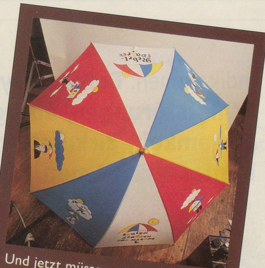
Und jetzt müssen wir Ihnen den Schirm halt ohne Herrn Schüüch zeigen.

Wir hoffen, dass Sie dies dem Herrn Schüüch nicht übelnehmen und den Schirm trotzdem bestellen. Denn eines können Sie sicher sein: Sein Schirm lässt Sie garantiert nie im Regen stehen! (Gezeichnet von Hans Moser und für Nebelspalter -Abonnenten zum Spezialpreis erhältlich: nur 39.— Franken. Nicht-Abonnenten 58.— Franken.)