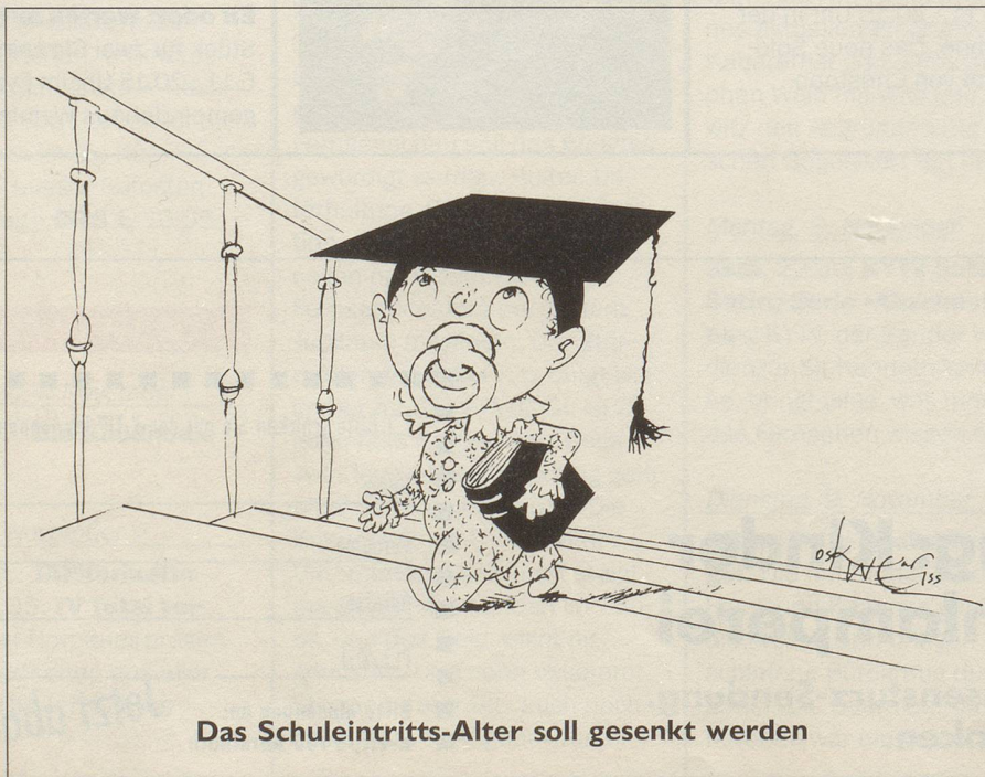
Das Schuleintritts-Alter soll gesenkt werden