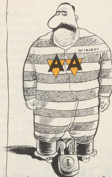
AUSLÄNDER IN AUSSCHAFFUNGS- HAFT