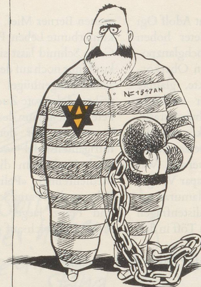
AUSLÄNDER IN VORBEREITUNGS- HAFT